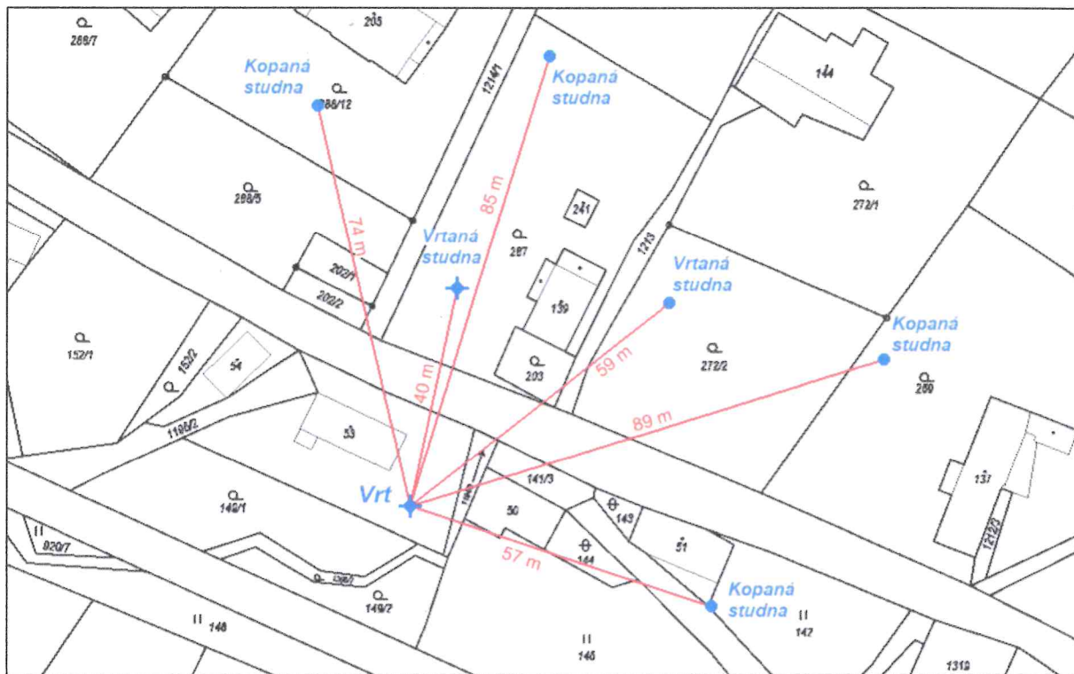
Obr. 2: Zákres projektované studny na pozemku parc. č. st. 53 (měřítko 1 : 1 200)